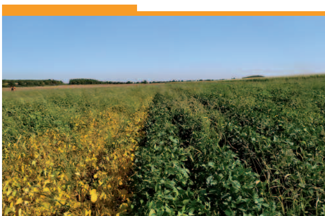
Ambella/Herta (1 er septembre)

La précocité des différentes variétés était très marquée, mais l'hétérogénéité de la parcelle n'a pas permis de mettre en évidence des différences significatives de rendement.