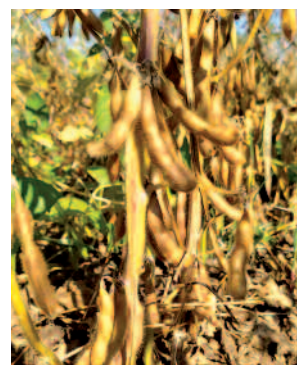
1 re gousse (22 septembre)