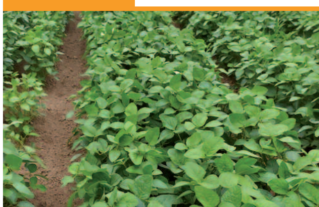
Essai le 29 juin 2022

au soja d'exprimer pleinement son potentiel sur cet essai. Ainsi, les variétés plus tardives (00) n'ont pas permis un meilleur rendement que les précoces (000).