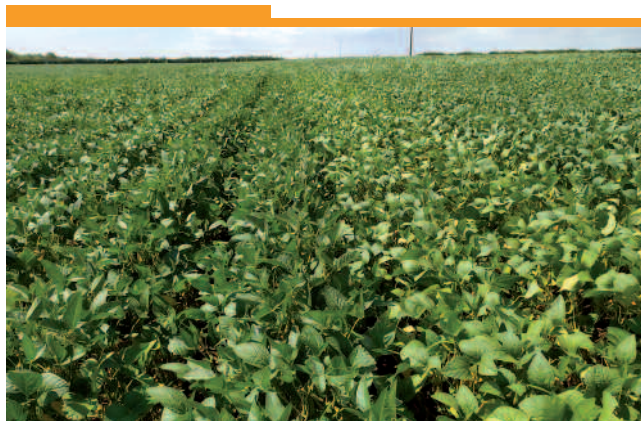
Essai le 28 juillet 2022

permis un meilleur rendement que les précoces (000). L'écartement 55 cm permet un binage et un bon recouvrement de l'inter-rang, idéal pour cette culture.