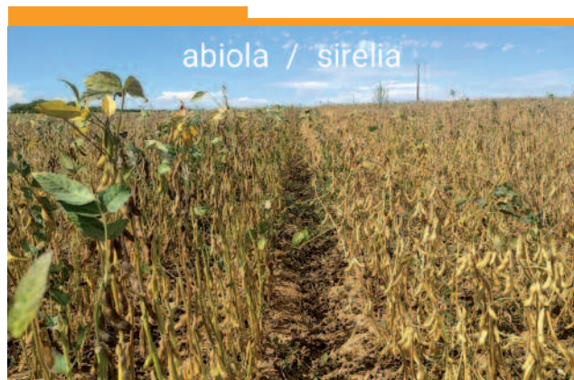
Essai le 24 août. Seule la variété Abiola avait encore quelques feuilles vertes