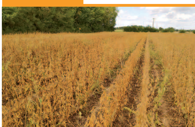
Essai le 09 septembre 2022