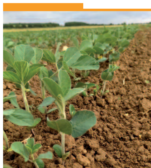
Soja semé en double-rang

La modalité 680 000 a été réalisée par simplification pour sa mise en œuvre dans l'essai, il aurait été préférable de faire 2 passages à densité équivalente, à 340 000 graines/ha pour éviter que les graines soient trop serrées sur le rang.