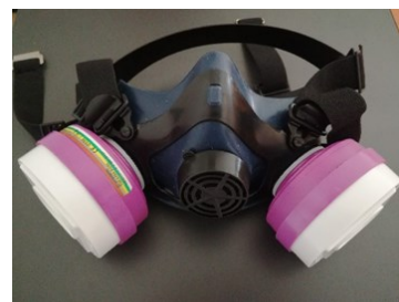
Masques réutilisables « à cartouches »

Il est conseillé d'essayer avant d'acheter afin d'avoir un masque adapté.