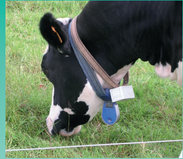
CHRISTOPHE SABLÉ PRÉSIDENT DE F@RM XP