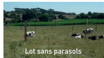
Lot sans parasols