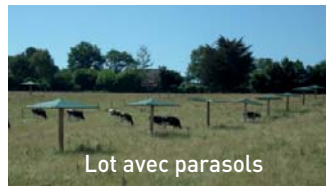
Lot avec parasols